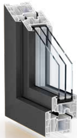
FOLIERT IN UNIFARBEN