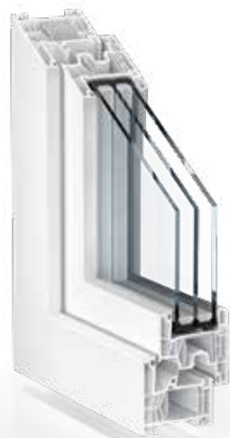
KLASSISCH PVC WEISS

Farben, Formen, Strukturen – diese Variablen machen das Gestaltungsspektrum von Kömmerling 88 Mitteldichtung so facettenreich. Ob modern oder klassisch, weiß oder bunt: Ihre Wahlmöglichkeiten sind riesig. Entdecken Sie die große Vielfalt unserer faszinierenden Oberflächen und prägen Sie den Charakter Ihres Hauses. Lassen Sie sich von unserem Gesamt-Folienprogramm inspirieren. Hier haben Sie die Wahl zwischen Holzstruktur, Uni- oder Metallicfarbe. Und das entweder nur außen – dabei innen neutral PVC Weiß – oder beidseitig foliert.