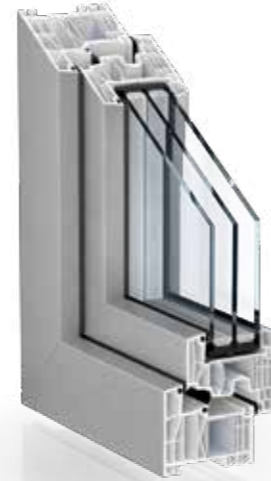
FOLIERT IN METALLIC- OPTIK