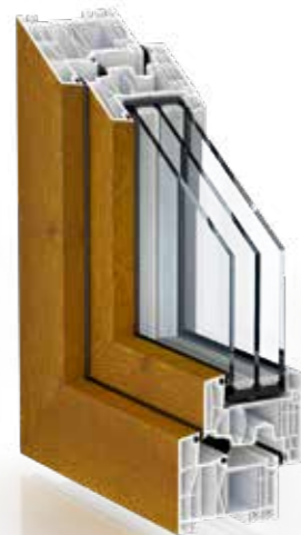
FOLIERT IN HOLZSTRUKTUR