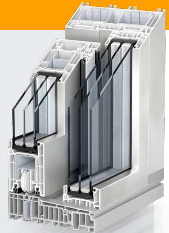
Kömmerling PremiDoor 76 Lux